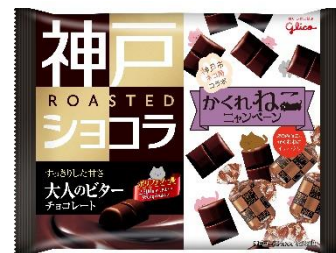
大人のビターチョコレート

神戸ローストショコラのパッケージ内面に、神戸がモチーフのデザインに猫が隠れたイラストをプリントしています。