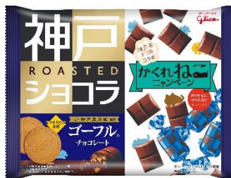
ゴーフルチョコレート