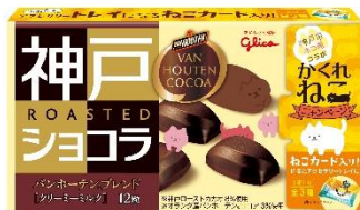
バンホーテンブレンド<クリーミーミルク>