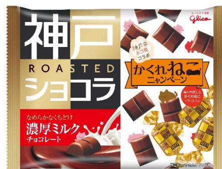
神戸ローストショコラ 濃厚ミルクチョコレート