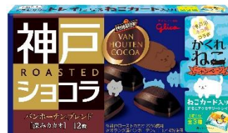
バンホーテンブレンド<深みカカオ>

神戸ローストショコラ バンホーテンブレンドには、トレイになるねこカードが箱の中に入っています(全3種類)。チョコレートを置いたり、アクセサリを置いたり。置いたものとイラストが組み合わせることで、さらにかわいさUP！