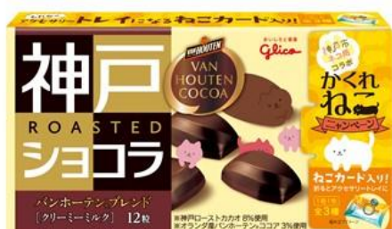
神戸ローストショコラ バンホーテンブレンド<クリーミーミルク>

「神戸ローストショコラ」ブランドはこのキャンペーンを通して、猫の可愛いパッケージに癒されながらリラックスできる日々のチョコレートタイムをお届けし、また、人と猫とのさらなる共生の実現に貢献します。