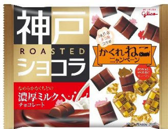
濃厚ミルクチョコレート